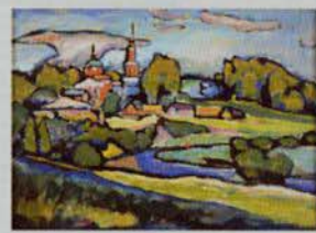
ワシリー・カンディンスキー (アフトールカ 赤い教会の風景) 1917年