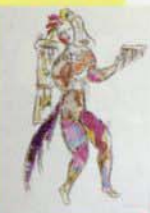
マルク・シャガール (シリーズ: モーツァルト「魔笛」 パヴァーゼ) 1966-1967年