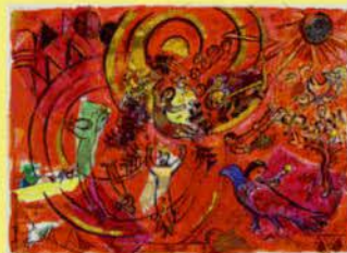
マルク・シャガール (シリーズ: モーツァルト「魔笛」 背景幕 第II幕第30場 フィナーレ) 1966-1967年

シリーズをまとめて初公開! ニューヨーク・メトロポリタン 歌劇場のためのモーツァルト歌劇 「魔笛」の舞台美術シリーズ