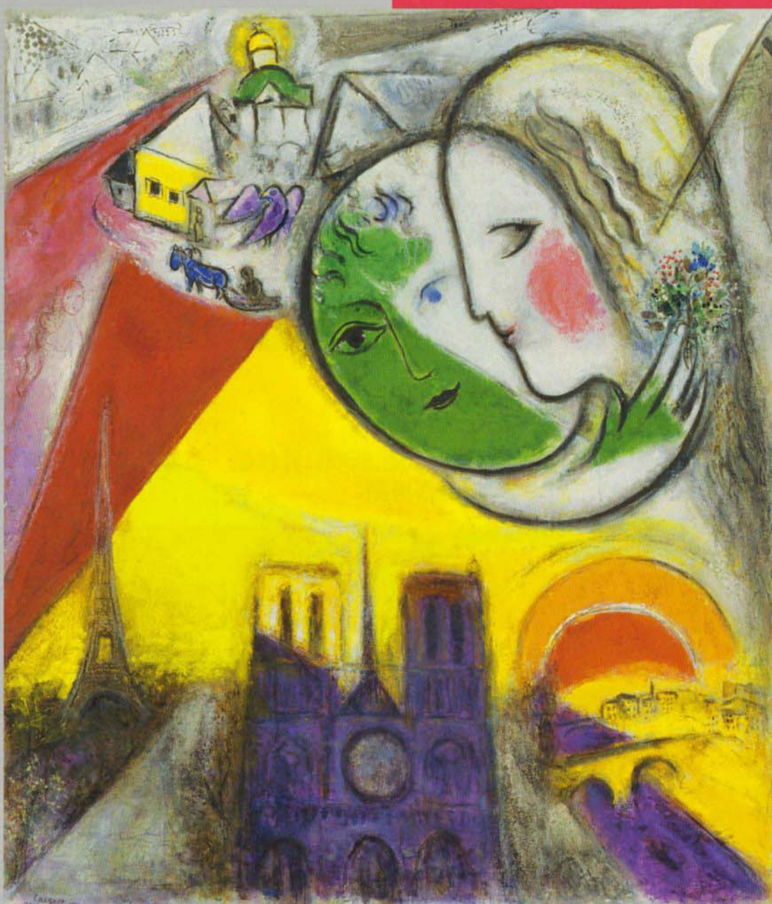
マルク・シャガール《日曜日》1952-1954年, CHAGALL®