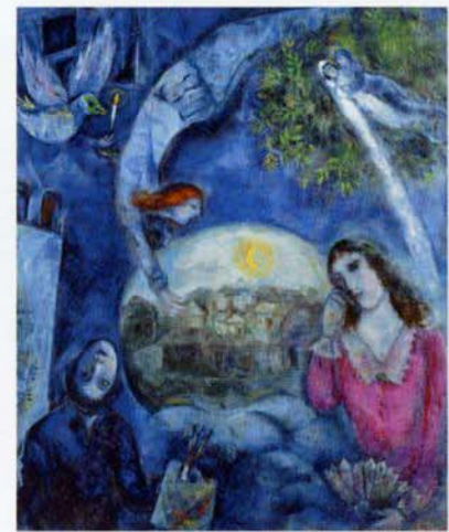
マルク・シャガール(彼女を巡って) 1945年