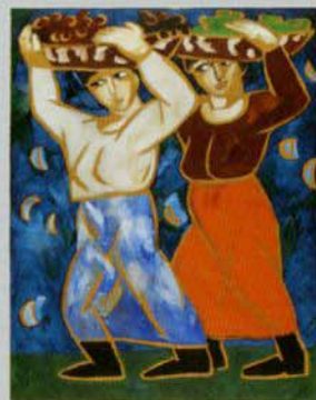
ナターリヤ・ゴンチャロワ (収獲物を運ぶ女たち) 1911年