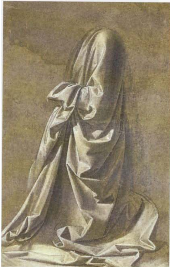
▲レオナルド・ダ・ヴィンチ《衣敷の習作》(部分) 1470-75年頃 テンペラ・鉛白・亜麻布 パーバラ・ピエセッカ・ジョンソン・コレクション財団

LEONARDO DA VINCI E L'IDEA DELLA BELLEZZA