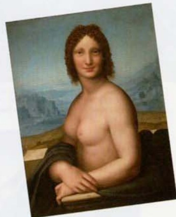
▲レオナルド・ダ・ヴィンチ構想/ソライイ（複製） 《種のモナ・リザ》16世紀 油彩・キャンヴァス レオナルド・ダ・ヴィンチ理想博物館寄託