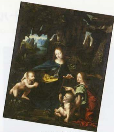
▲レオナルド・ダ・ヴィンチと弟子 (名賢監修カルロ・ペドレッティ氏蔵)《紡錘の聖母》1495-97年頃 油彩・キャンヴァス 個人蔵