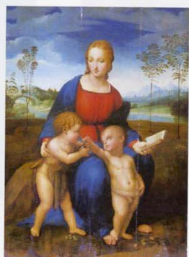
▲「ソフマエロとその工房」(複製) (ピエトロの聖母) 1505年以降 油彩・板 個人蔵