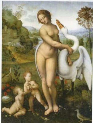
▲レオナルド・ダ・ヴィンチの美の理想 (1506-08年頃) 大塚園芸 複製 ロイヤルホルゲイゼン美術館蔵