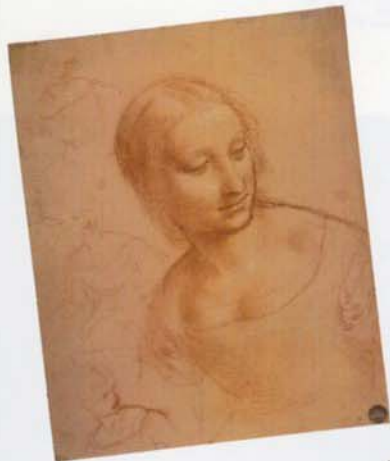
▲レオナルド・ダ・ヴィンチと弟子「紡錘の聖母」の習作 16世紀初頭 サンギース・赤く地塗りをした紙 ヴェネツィア、アカデミア美術館蔵