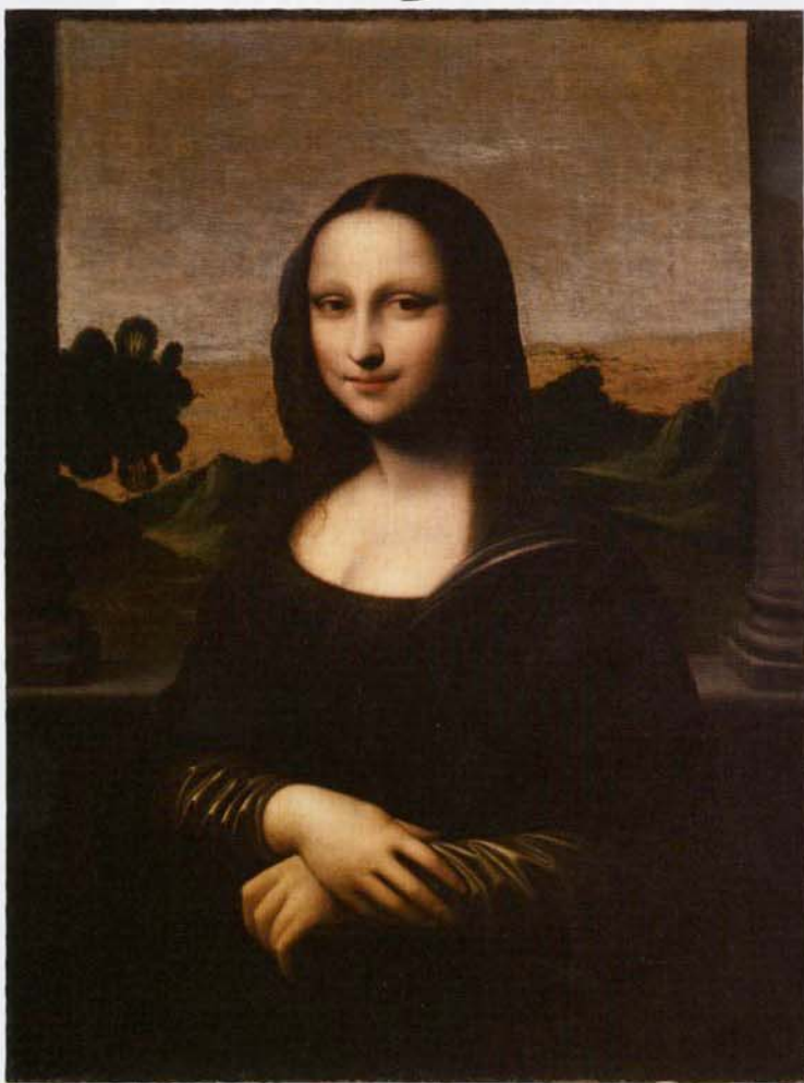
▲《アイルワースのモナ・リザ》16世紀（レオナルドによる1503年の未完成作脱あり）油彩・キャンヴァス・個人蔵