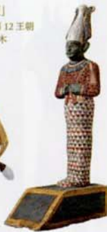
◀「オシリス神像」 新王国時代・第20王朝・前1100年頃 木、彩色