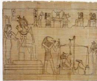
▲「グリーンフィールド・パピルス（ネシタネベトイシエルの『死者の書』）」(部分) 第3中間期・第21王朝末期～第22王朝初期・前950～前930年頃 パピルス、インク

最長の『死者の書』 「グリーンフィールド・パピルス」 大英博物館外での 全点紹介は世界初