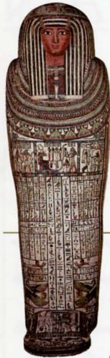
▲「パセンホルの本棺」 第3中間期・第22王朝末期 もしくは第25王朝初期 前750～前720年頃 木、彩色