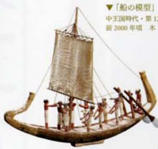
▼「船の模型」 中王国時代・第12王朝 前2000年頃 木

古代エジプトでは、人は死後に冥界の旅を経て、来世で復活すると考えられていました。永遠の生命を信じた古代エジプトの人々を、1500年の長きにわたって来世に導いたガイドブックが「死者の書」です。そこには冥界の畑や川、死者が出会う神や怪物、心臓を天秤にかける場面など、死後の世界へいたる過程が文字と絵によって克明に描かれています。本展は、「死者の書」の記述をもとに、