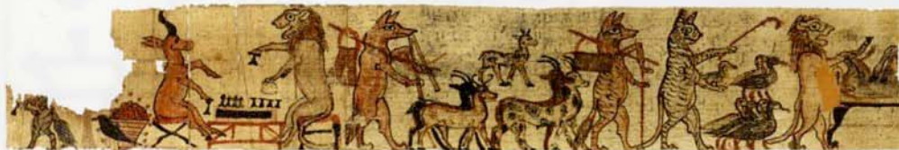
▲「動物の風刺パピルス」 新王国時代・第19王朝～第20王朝・前1295～前1069年頃 パピルス、彩色