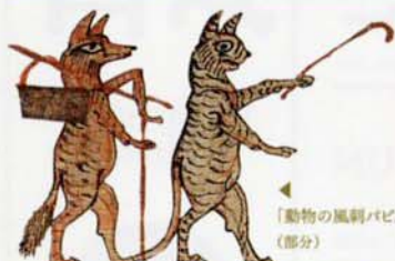
▲「動物の風刺パピルス」(部分) ※早割ペアチケット取扱：チケットぴあ(Pコード765-162)、ローソンチケット(Lコード87179)、セブンチケット(セブンコード016-414)、イープラス/ファミリーマート、アクロス福岡チケットセンター ほかに主要プレイガイド

お得な 早割ペアチケット 2,000円 6/1～7/31まで 期間限定販売 (一般のみ)