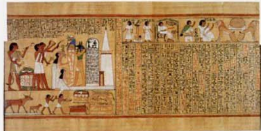
▲「フウネフェルの『死者の書』口開けの儀式的場面」 新王国時代・第19王朝・前1280年頃 パピルス、彩色

最長の『死者の書』 「グリーンフィールド・パピルス」 大英博物館外での 全点紹介は世界初