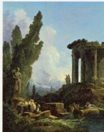
《古代の廃墟》1779年、ルーヴル美術館(リヨン美術館へ寄託)