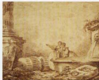
《廃墟の中の水飲み場》1774年、ヴァランス美術館