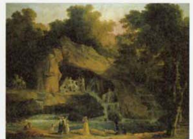
《ヴェルサイユのアポロンの水浴の木立》1803年、カルナヴァレ美術館