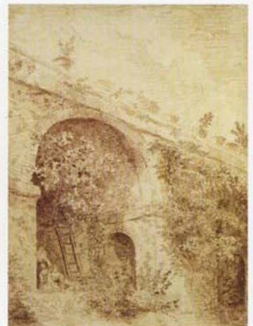
《ヴィル・マダムの後園女たち》1762年、ヴァランス美術館