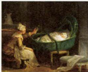
《赤ん坊に哺乳瓶をさし出す若い女》1772年、ヴァランス美術館