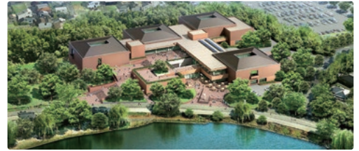
リニューアル後の全景 (イメージ図)