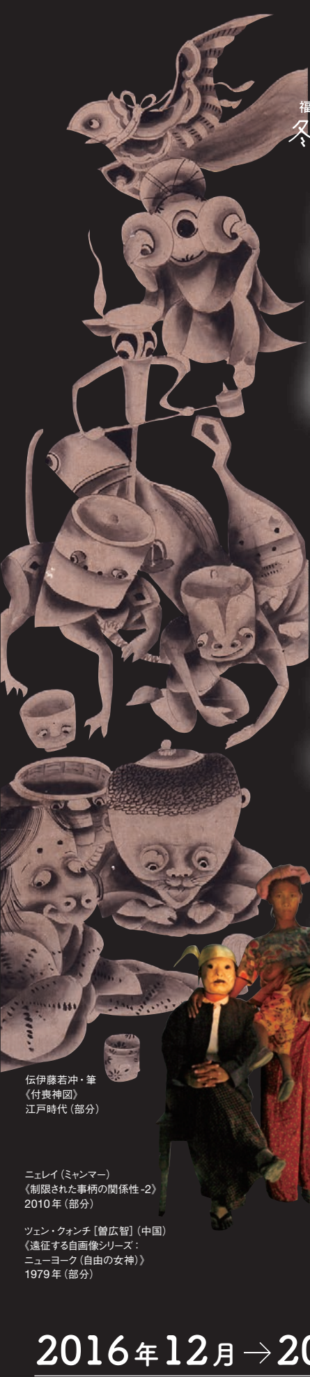
伝伊藤若冲・筆 (付喪神図) 江戸時代(部分)