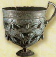
カンタロス形の杯 (ポンペイ 百年祭の家出土、ナポリ国立考古学博物館蔵)