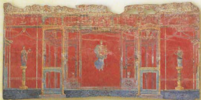
「琴琴弾きのアポロ」が表された北壁の壁画（モレージネ 建造物A出土、ポンペイ考古学監督局蔵）

古代ローマ帝国が「人類史上、最も幸福な時代」と讃えられる絶頂期にさしかかったころ、突然の大災害が南イタリアを襲いました。西暦79年8月24日午後1時、ヴェスヴィオ山から巨大な火柱が噴き上がったのです。噴火は翌朝まで続き、ポンペイなどふもとの町々が埋没しました。夏のまぶしい太陽は灰雲にさえぎられ、住人たちは闇の中、持てる限りの財産を手を町を脱出。噴出物に厚く覆われた都市は復興することなく、ようやく18世紀に発掘が始まりました。展覧会は、かつてヴェスヴィオ山周辺の暮らしを彩っていた壁画や宝飾品、彫像など400件余りの第一級の宝物を紹介し、19時間にわたった噴火の悲劇を辿ります。欧米各国で好評を博した展覧会がいよいよ福岡で公開されます。