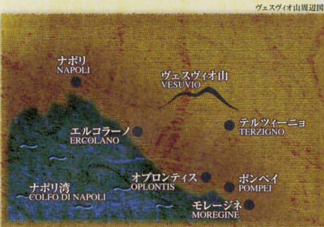
ヴェスヴィオ山周辺図