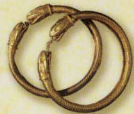
ヘビ形の腕輪 (エルコラーノ 古代の海岸出土、ポンペイ考古学監督局蔵)