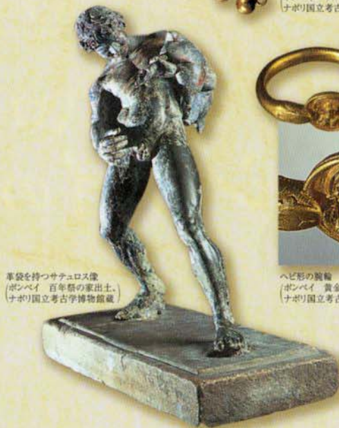
革袋を持つサテロス像 (ポンペイ 百年祭の家出土、ナポリ国立考古学博物館蔵)