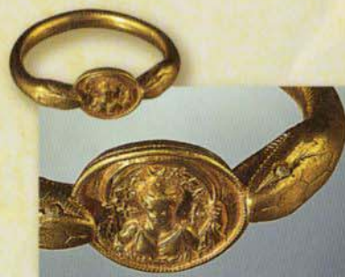
ヘビ形の腕輪 (ポンペイ 黄金の腕輪の家出土、ナポリ国立考古学博物館蔵)