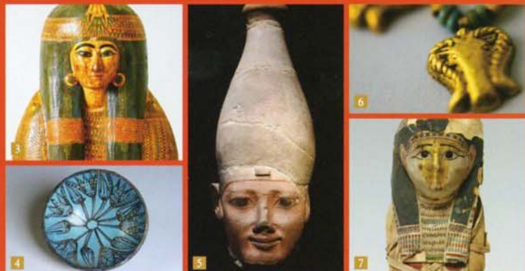
1.「イビの石製人型棺の蓋」末期王朝時代、前664—前610年頃 2.「アメン・ラー神に牡羊の頭部を捧げるベンシエナプの像」新王国時代、前1292—前1186年頃 3.「タカバエンコンスの人型像」第3中間期、前990—前970年頃 4.「ロータス文様のファイアンス製容器」新王国時代、前1550—前1070年頃 5.「オシリス神をかたどった王の巨象頭部」新王国時代、前1504—前1492年頃 6.「牡羊の頭の首飾り」第3中間期—末期王朝時代、前746—前525年頃 7.「子供のミイラ」アトレマイオス時代、前332—前30年 西川よしえ美術(個1・2・4・7はトリノ・エジプト博物館提供)